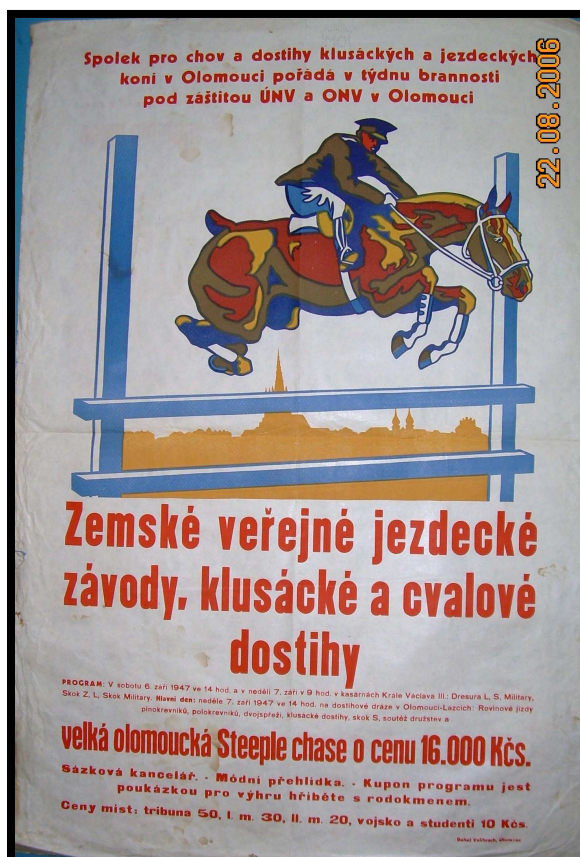
Příloha č. 15: Valihrachem vytištěných plakát z roku 1946.