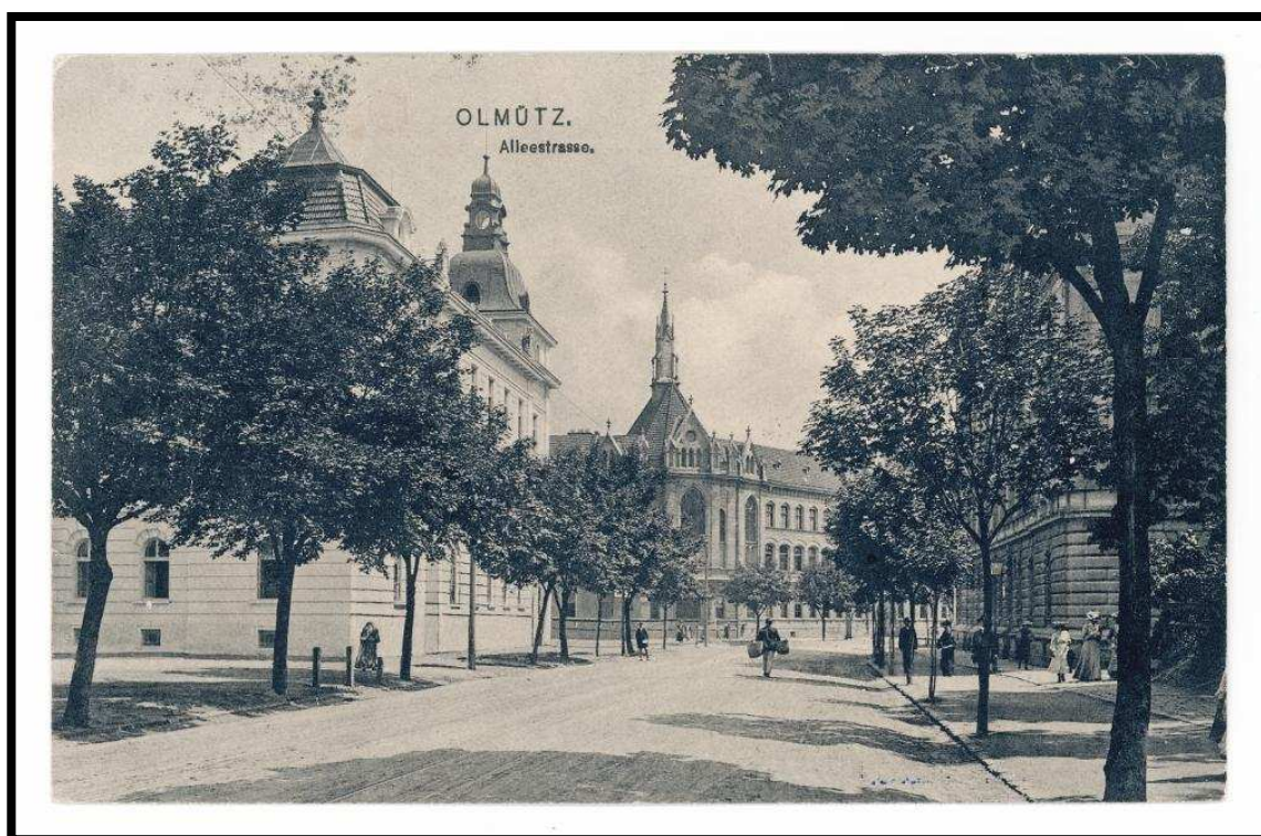
Příloha č. 16: Ulice Stromořadí kolem roku 1900, v pozadí Pöttingův ústav.