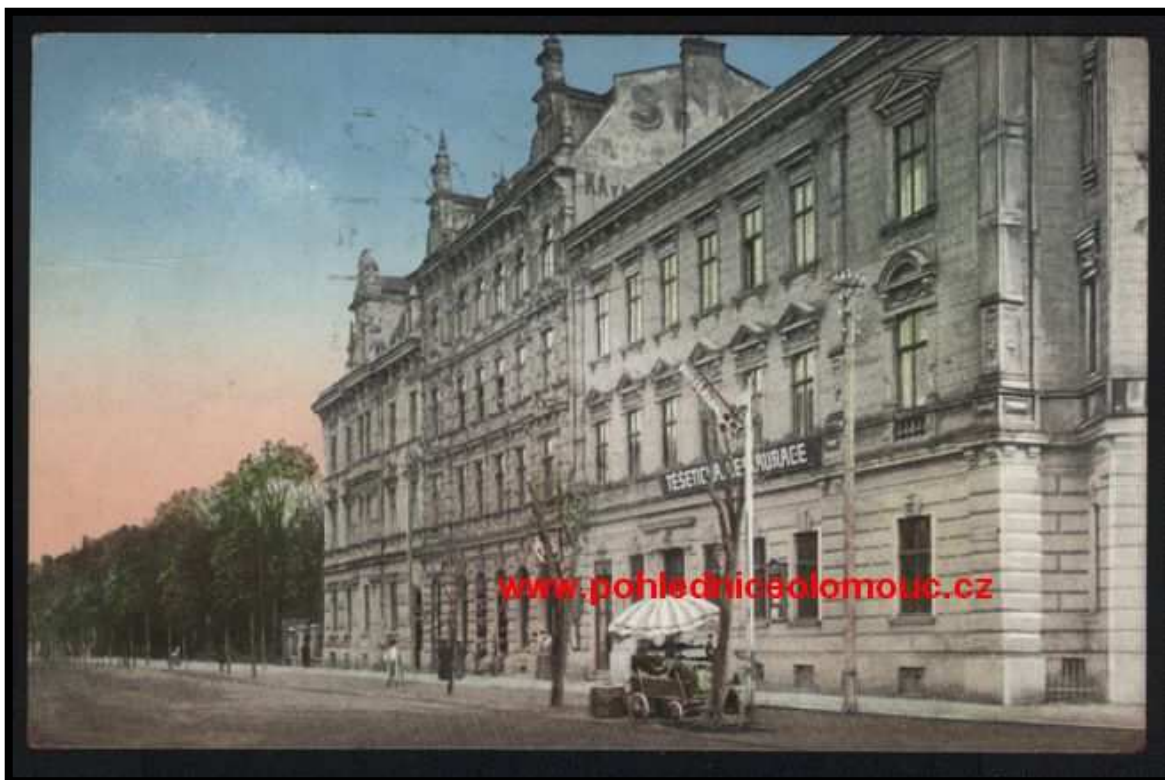
Příloha č. 16: Kolorovaná fotografie ulice Stromořadí před rokem 1918, v pozadí Englischův dům.