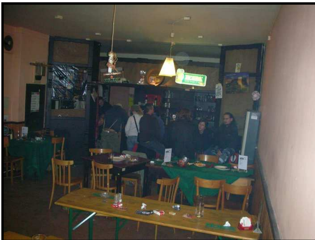
Příloha č. 14: Interiér pivnice z roku 2007.