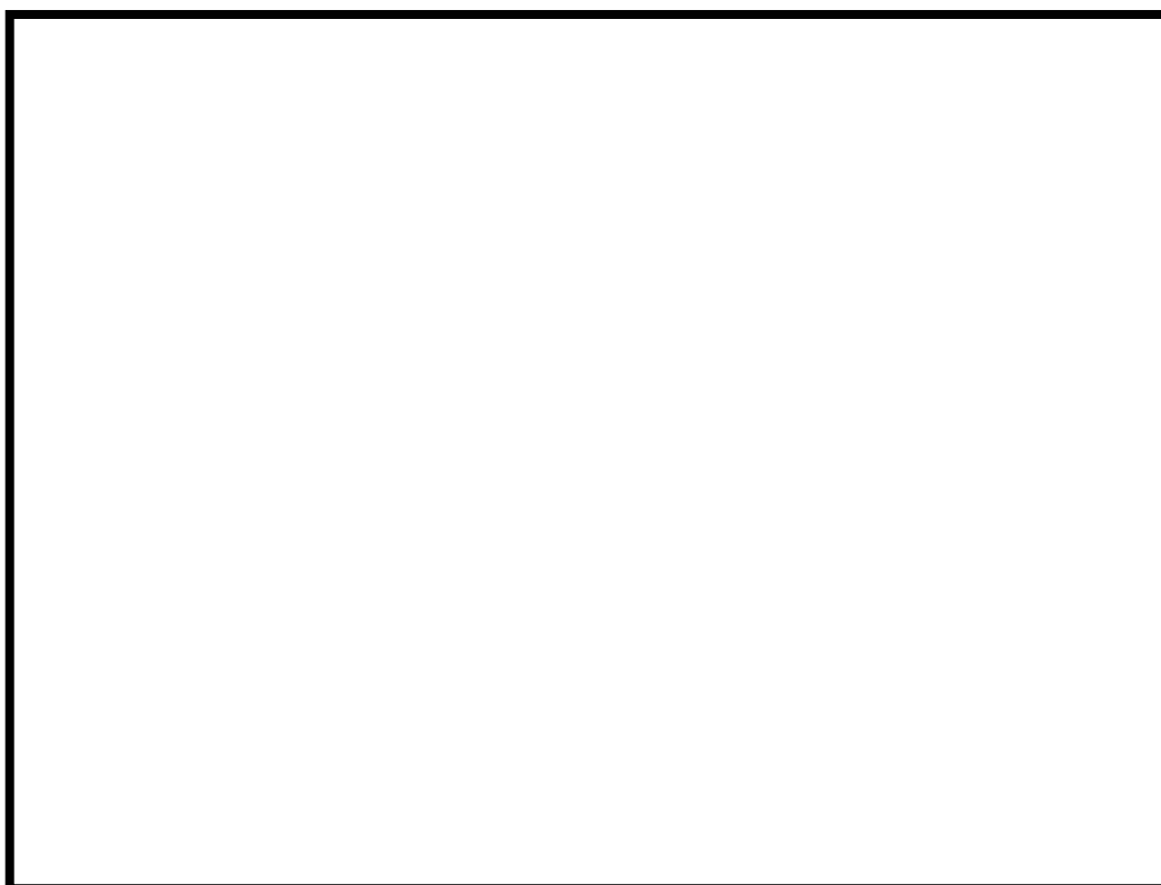
Příloha č. 13: Zahrádka pivnice v zimě 1999.